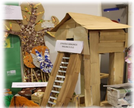
Skupni zmagovalci natečaja Ekopaket 2016/2017: